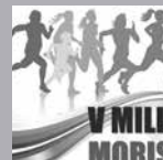
V Milla Morisca

Dentro de las actividades previas a la semana de feria se celebra la Milla urbana