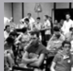
Local de ensayos

La agrupación musical estrena local de ensayo cedido por el Ayuntamiento